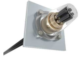
EHD アンカーHP (KJS 協会)