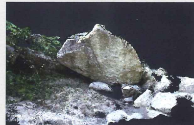
巨石の概要を把握